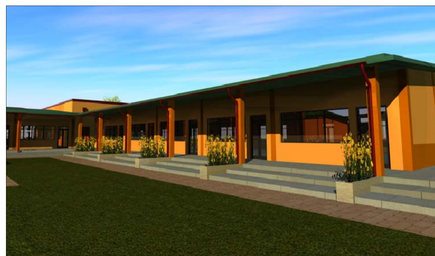
Prospetto Nord - Ovest dall'alto