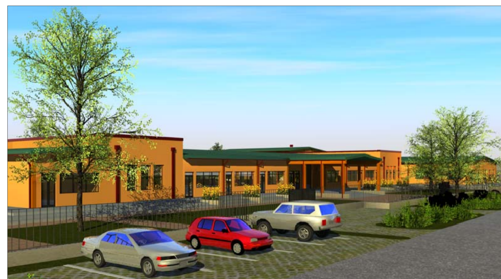
Vista Nord - Ovest dal basso