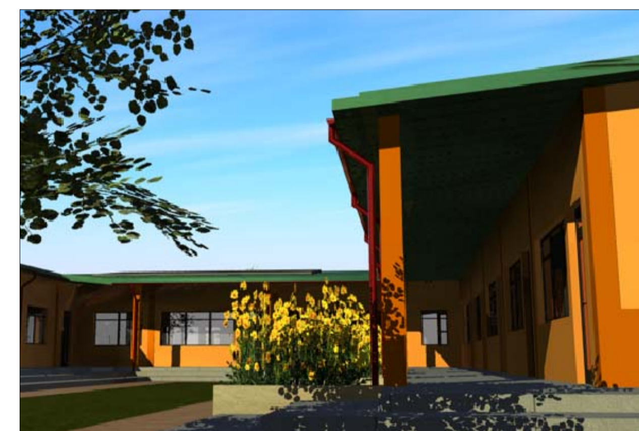
Prospetto Nord - Ovest dall'alto