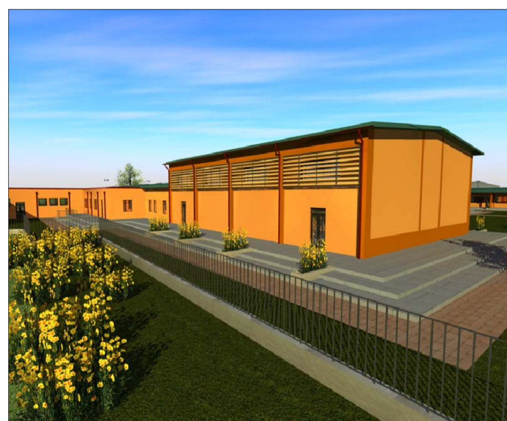
Prospetto Nord - Ovest dall'alto