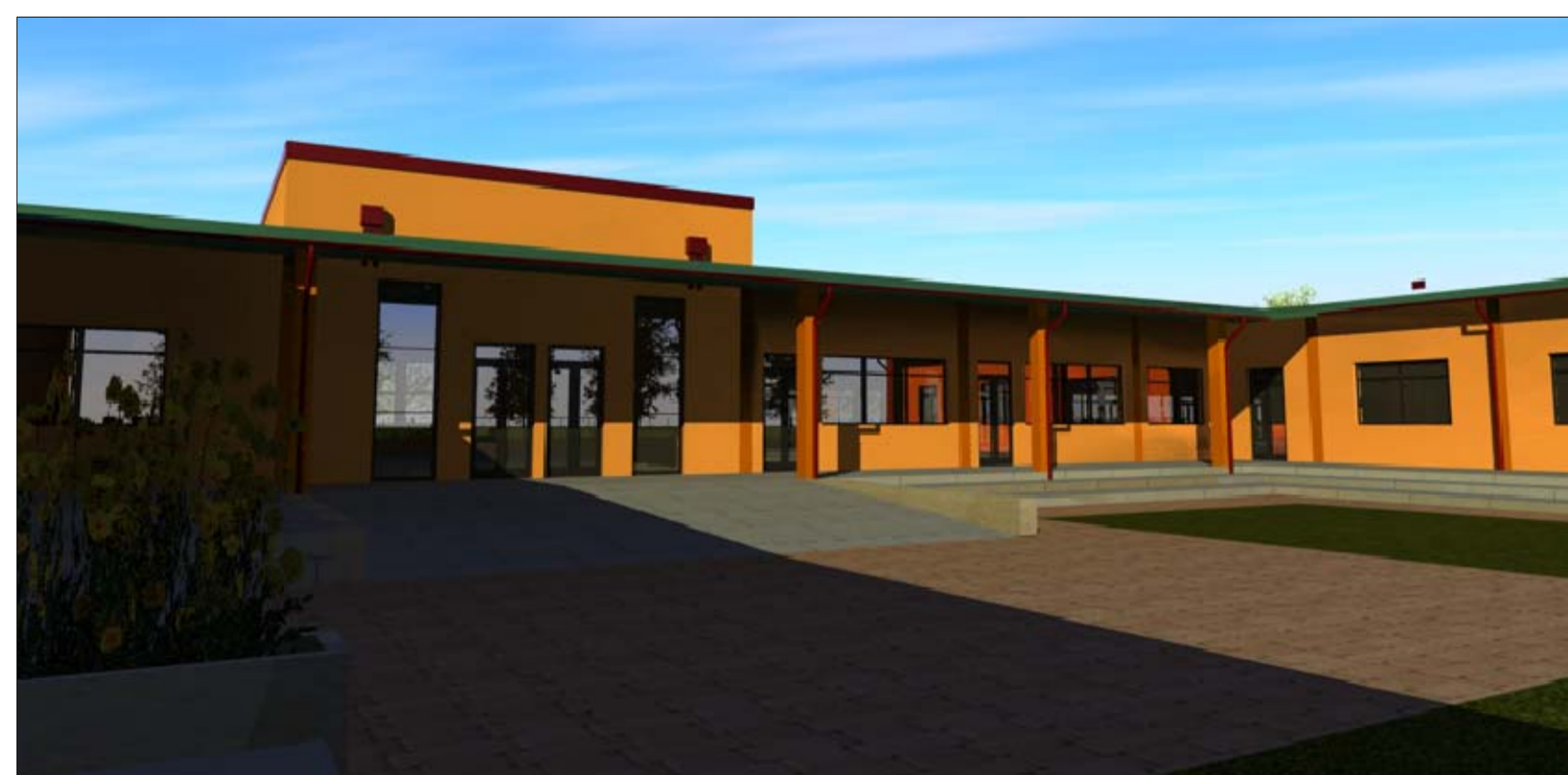
Prospetto Nord - Ovest dall'alto