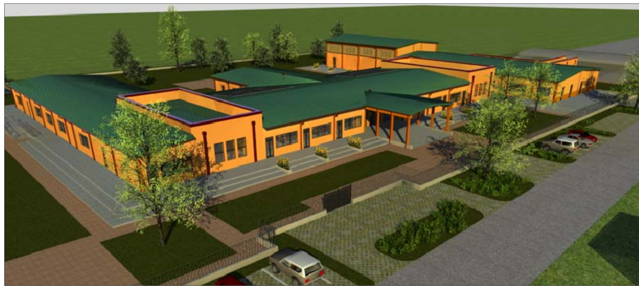
Prospetto Nord - Ovest dall'alto