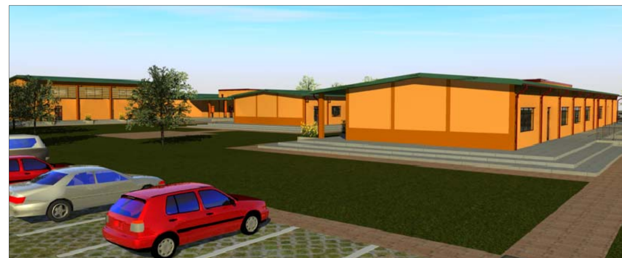
Prospetto Nord - Ovest dall'alto