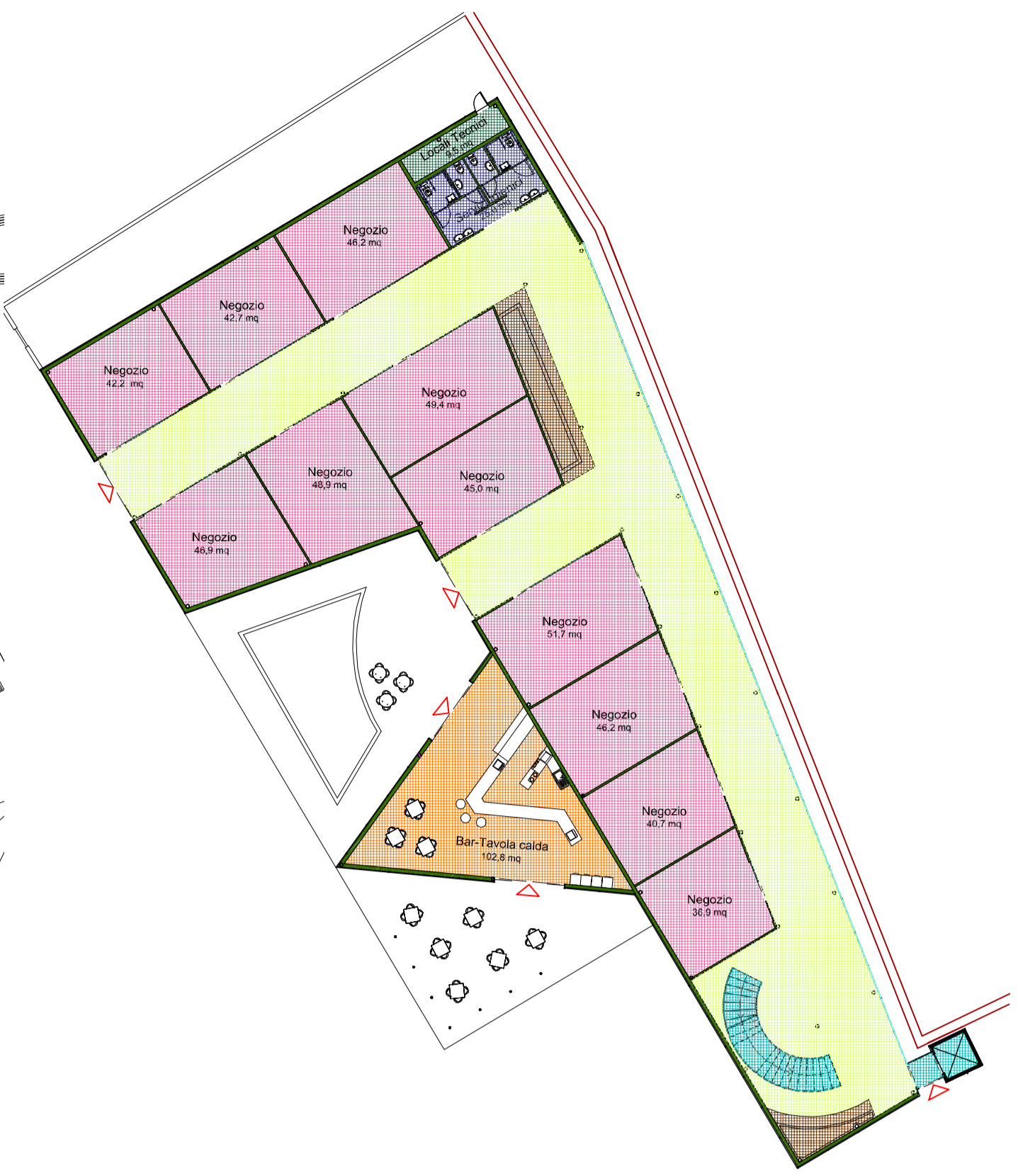
SCHEMA FUNZIONALE DEL PIANO TERRA